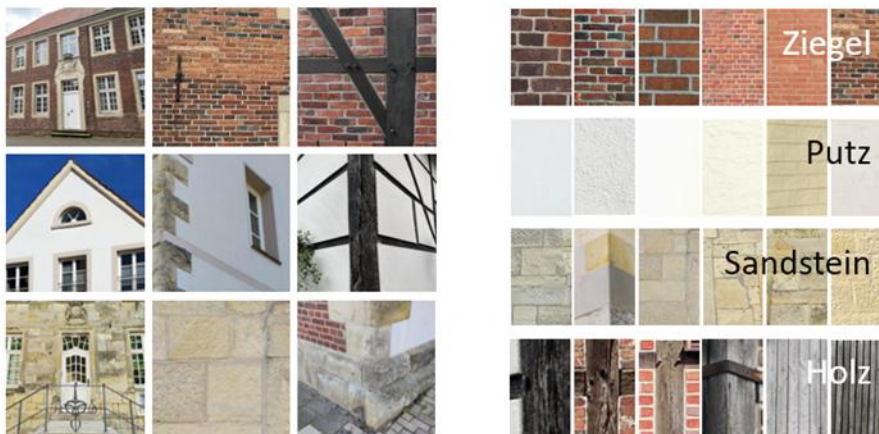
Abb. 3 – Ortstypischer Materialkanon