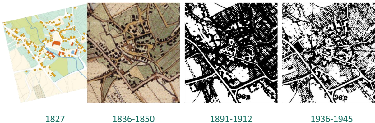
Abb. 2 – Historische Karten des Ortskerns im Vergleich