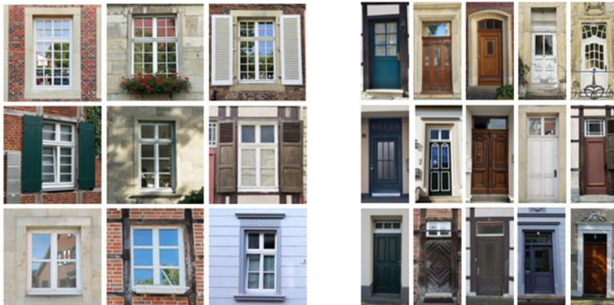
Abb. 5 – Ortstypische Fenster und Türen