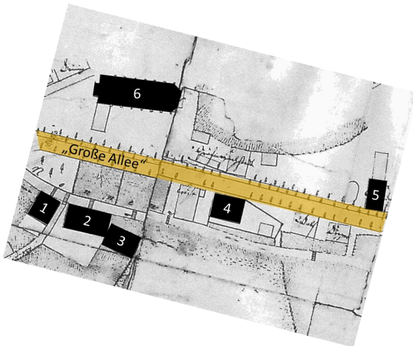
Abb. 1 – Nottulner Stiftsbezirk im Jahre 1825

Nottuln hat mittelalterliche Wurzeln: Im 9. Jahrhundert erfolgte im heutigen Ortskern der Bau einer Pfarrkirche und die Gründung eines Damenstifts in direkter Nachbarschaft, dessen Bedeutung in den folgenden Jahrhunderten weiterwuchs und seine Blütezeit im 13. Jahrhundert hatte. Nach großflächigen Zerstörungen durch einen Brand 1748 wurde der Stiftsbezirk unter der Leitung des barocken Baumeisters Johann Conrad Schlaun wieder aufgebaut. Zentrale Elemente der damaligen Planung – die große Allee, vier Kuriengebäude, die Alte Amtmannei sowie die barocke Turmhaube und das Walmdach der St. Martinus Kirche – sind dabei bis heute erhalten geblieben.